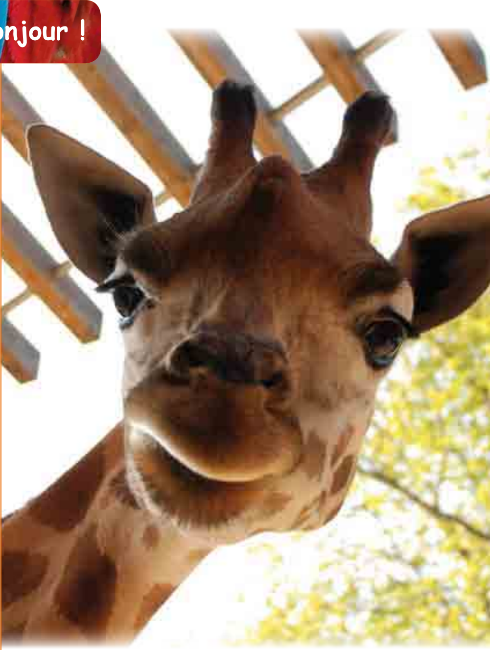
la Girafe UELE

À renvoyer à l'association des Amis du Zoo de Lyon 32, rue Vaubecour - 69002 Lyon, accompagné d'un chèque correspondant au type d'adhésion choisi.